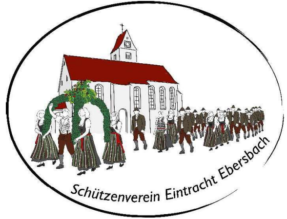
Königswertung - Teilnehmer & Schusszahlen